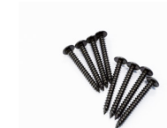
トラスタッピングビス (黒) 4×35 4本 (左右セットの場合 8本)

専用ステーは上下で形状が異なります。 上側用のステーは、少し角度が付いています。 下側用のステーは、ほぼ直角の形状です。