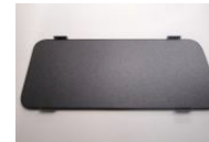
パネル本体 ※運転席側・助手席側で形状が異なります。