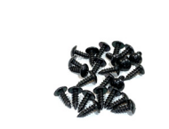
トラスタッピングビス (黒) 4×12 16本 (左右セットの場合 32本)