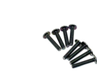
M4トラスボルト22mm(黒) 4本 (左右セットの場合 8本)