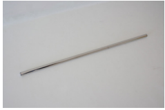
パイプ1本（左右セットの場合 は2本）