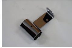
専用パイプ受け金具 後側1個（左右セットの場 合は2個） ※左右共通