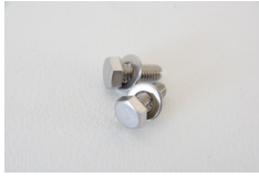
M6 × 20mm ボルト2本（左 右セットの場合は4本） M6 ワッシャー 2個（左右 セットの場合は4個）