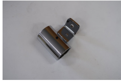
専用パイプ受け金具 前側1個（左右セットの場 合は2個） ※左右で形状が異なります。