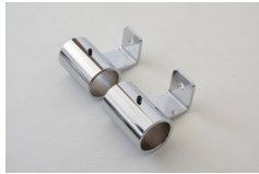
専用パイプ受け金具 2個