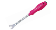
マイナスドライバー、もしくは内張りがし