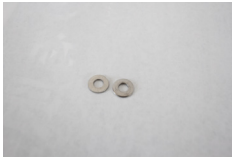
M4 ワッシャー 2個