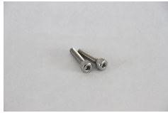
M4 × 20mm キャップスクリューボルト 2本