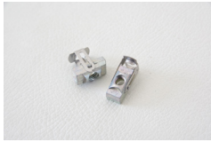
M4 ターンナット 2個