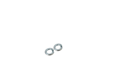
M4 スプリングワッシャー 2個