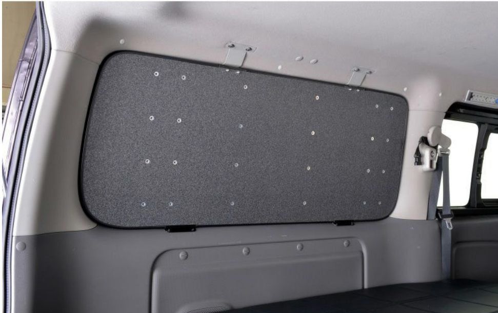
写真はプレミアム GX

このたびは弊社製品をお買い求めいただきまして誠にありがとうございます。 お取り付け、ご使用前にこの取扱説明書をよくお読みのうえ、正しくお使いください。 誤ったお取り付け、ご使用による事故等の責任は負いかねますのでご了承ください。