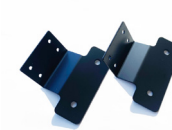
専用ステー上側（黒） 2個 (左右セットの場合4個)