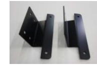
専用ステー下側（黒） 2個 (左右セットの場合4個)