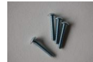
M4 トラスボルト 22mm (黒) 4本 (左右セットの場合 8本)