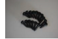
トラスタッピングビス (黒) 4 × 12 16本 (左右セットの場合 32本)