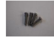
M6 六角ボルト 25mm 4本 (左右セットの場合 8本)