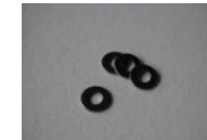
M4 ワッシャー 4枚 (左右セットの場合 8枚)