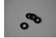
M6 ワッシャー 4個 (左右セットの場合 8個)