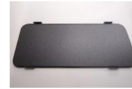
パネル本体 ※運転席側・助手席側で形状が異なります。