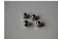
M4 袋ナット 4個 (左右セットの場合 8個)