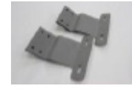
専用ステー上側 (グレー) 2個 (左右セットの場合 4個)