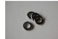
M4 スプリングワッシャー 4枚 (左右セットの場合 8枚)