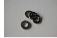
M6 スプリングワッシャー 4個 (左右セットの場合 8個)