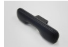
アームレスト本体 1個